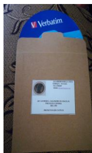
TRIPTICO B/3.00 PARA CONSEJERIA