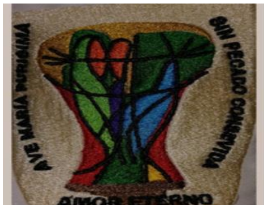
PROYECTOS EDUCATIVOS CUADERNO DE LABOR DOCENTE