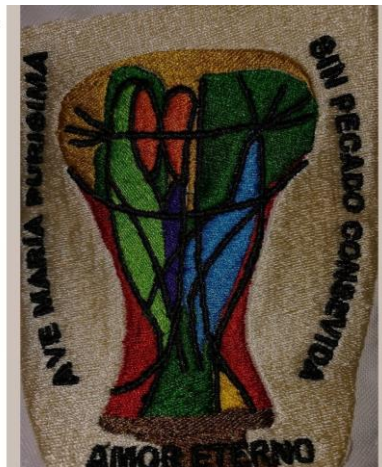
AGENDA ESTUDIANTEL B/10.00 2019

PROYECTO DE CALIDAD DE VIDA AGENDA PARA ESTUDIANTES FE SPANISH Y JORR VALORES DELTID MOIR PERDVI