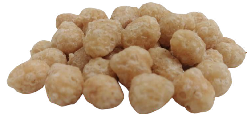
Forma del cereal