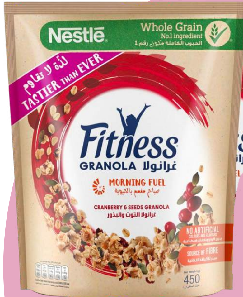
Presentación en bolsa

Ingredientes: Amaranto, chícharo, maíz nixtamalizado y arroz.