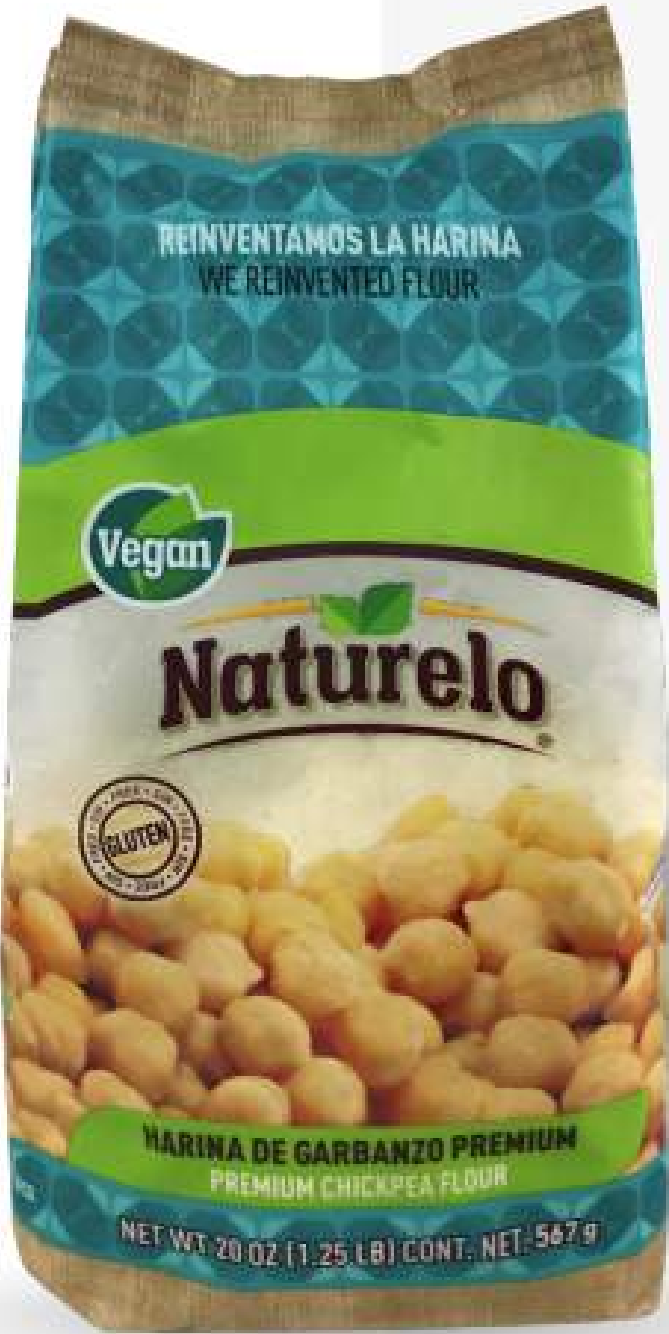
Presentación corrugado con 8 bolsas de 567 g

Substituye tapioca, papa, gomas y almidones en tus panes Gluten Free y sorpréndete de los resultados. Substituye almidones para espesar tus cremas, salsas y sopas mejorando su sabor y haciéndolas más nutritivas.