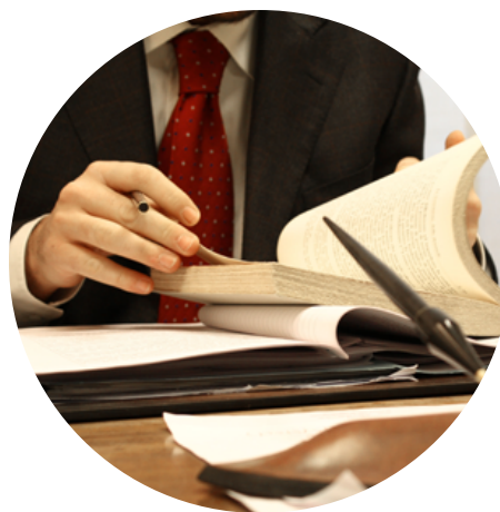
CONSULTORÍA Y AUDITORÍA