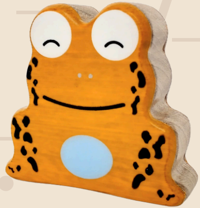
Rana arlequín Cód: 12131*