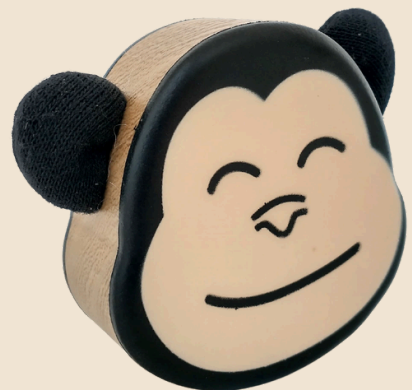
Mono araña Cód: 12121

*La rana arlequin está disponible en: azul, naranja, amarillo, morado 12131 - 12132 - 12133 - 12134