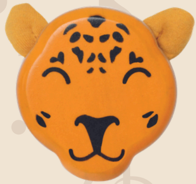
Jaguar Cód: 12111