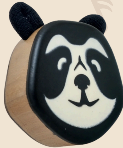
Oso de anteojos Cód: 12141