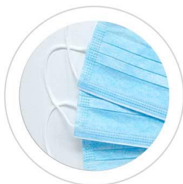
Cordón elástico y resistente

Todos nuestros Tapabocas superan los niveles mínimos de eficacia de filtración bacteriana según la normatividad EN 14683 Y NTC 1733