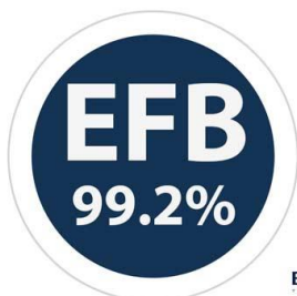
Eficacia de filtración bacteriana \geq 98