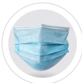
Respirable y cómodo