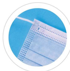
Termosellado con ultrasonido