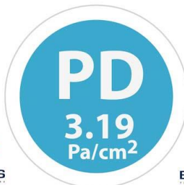
Presión diferencial o respirabilidad < 29.4 Pa/cm 2