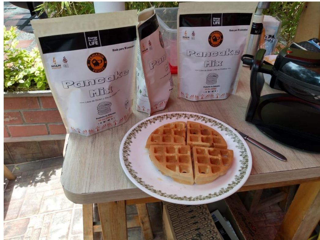
Harina de Pancakes