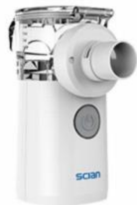
Nebulizador de Malla