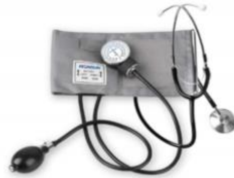
Toma de tensión