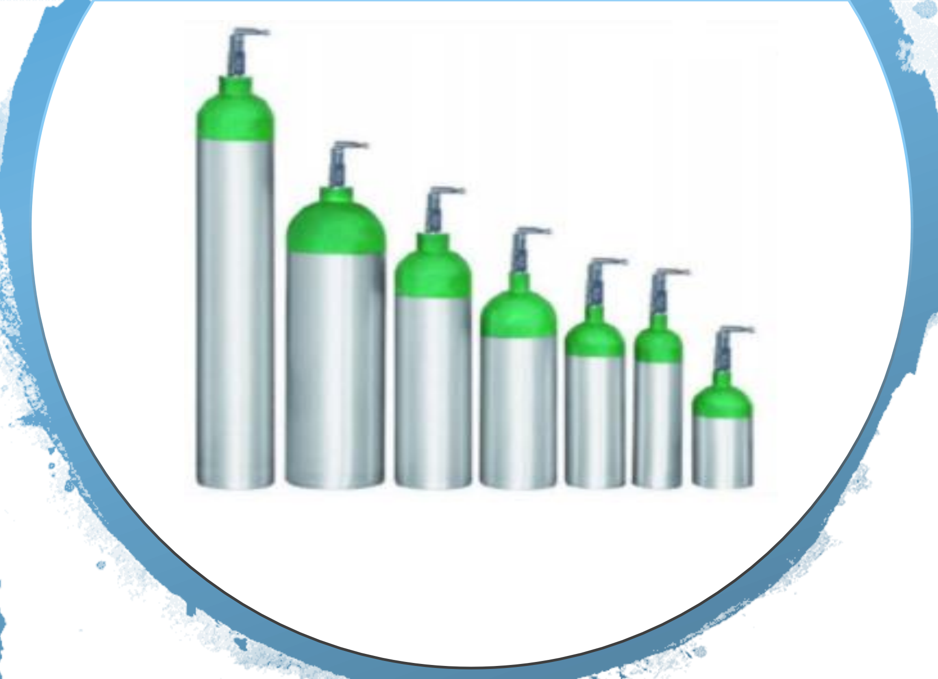
Cilindros Portátiles de Aluminio