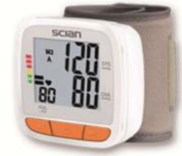
Monitor de Presión sanguinea Digital