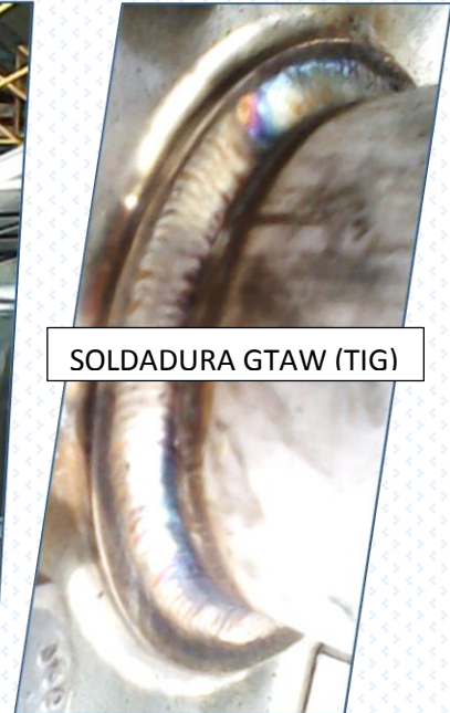
SOLDADURA GTAW (TIG)

Contamos con las herramientas necesarias para cumplir con los proyectos que se nos encomiende.