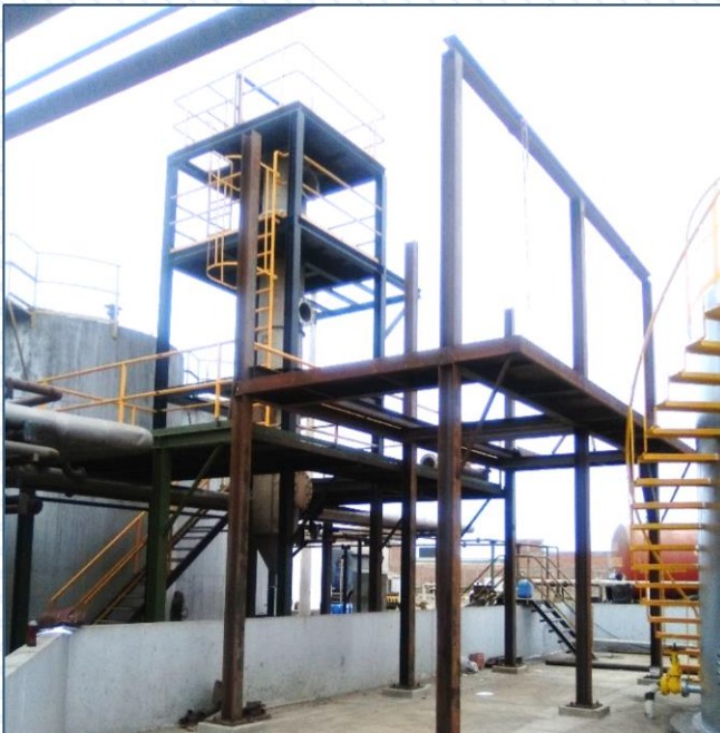
ESTRUCTURA DE DESTILADOR ATMOSFÉRICO – REFINERÍA HPO

Reformas de sistemas para mejorar la eficiencia y seguridad del proceso.