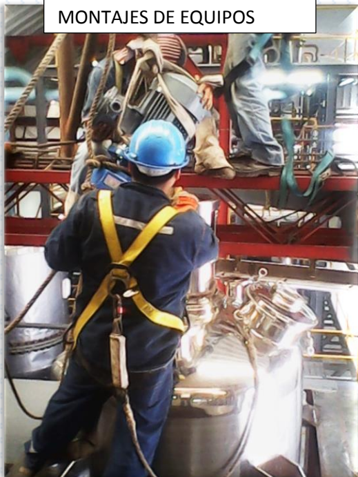
MONTAJES DE EQUIPOS