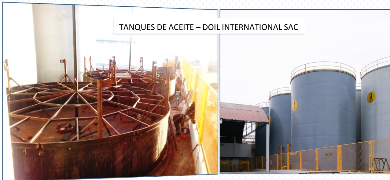
TANQUES DE ACEITE – DOIL INTERNATIONAL SAC