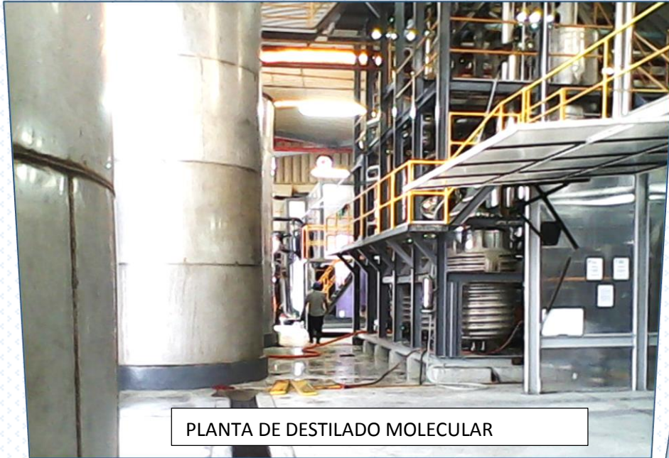
PLANTA DE DESTILADO MOLECULAR