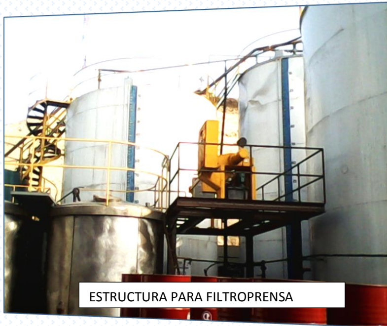
ESTRUCTURA PARA FILTROPRESA

Fabricamos, tanques para agua, aceite, combustible; reactores para todo proceso, naves industriales, intercambiadores de calor, equipos industriales en general.