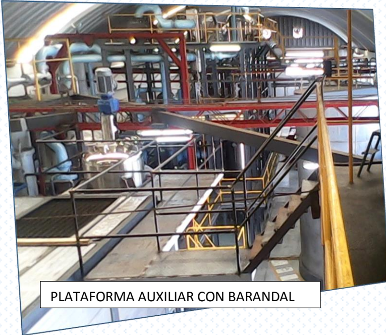
PLATAFORMA AUXILIAR CON BARANDAL

Fabricación de puertas, portones, barandas, escaleras, rejas, techos.