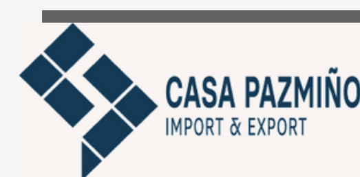
CASA LUIS PAZMIÑO IMPORT & EXPORT S.A.