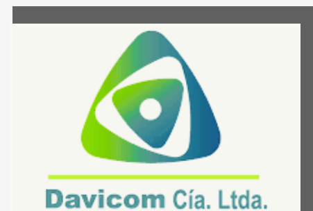
DAVICOM CIA. LTDA.