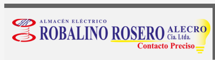
ALMACEN ELÉCTRICO ROBALINO ROSERO ALECRO CIA. LTDA.