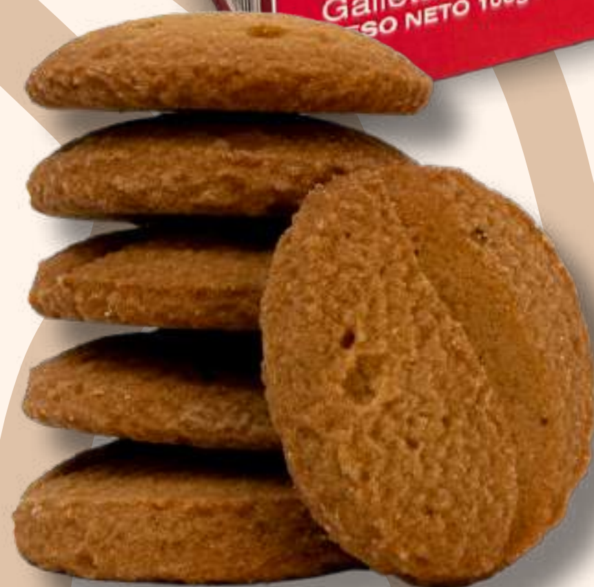
Café 100 gr – 30 gr