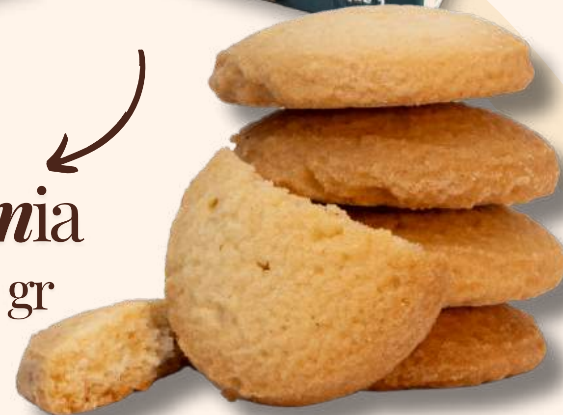
Macadamia 100 gr – 30 gr