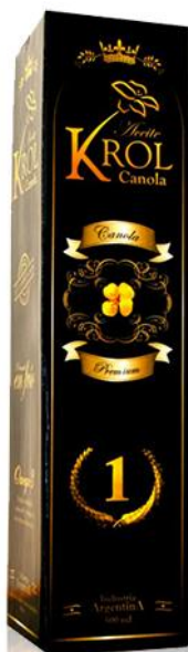
Масло канола Premium 500 мл