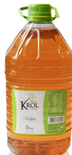
Масло канола 5л (без глютена)