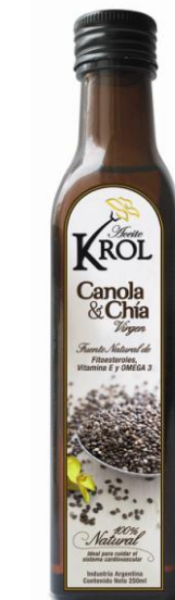
Масло канола с маслом chia 250 мл