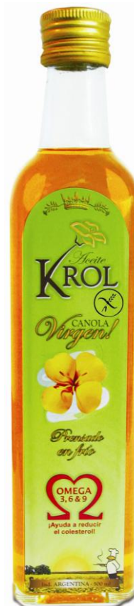
Масло канола 500 мл-250 мл (без глютена)