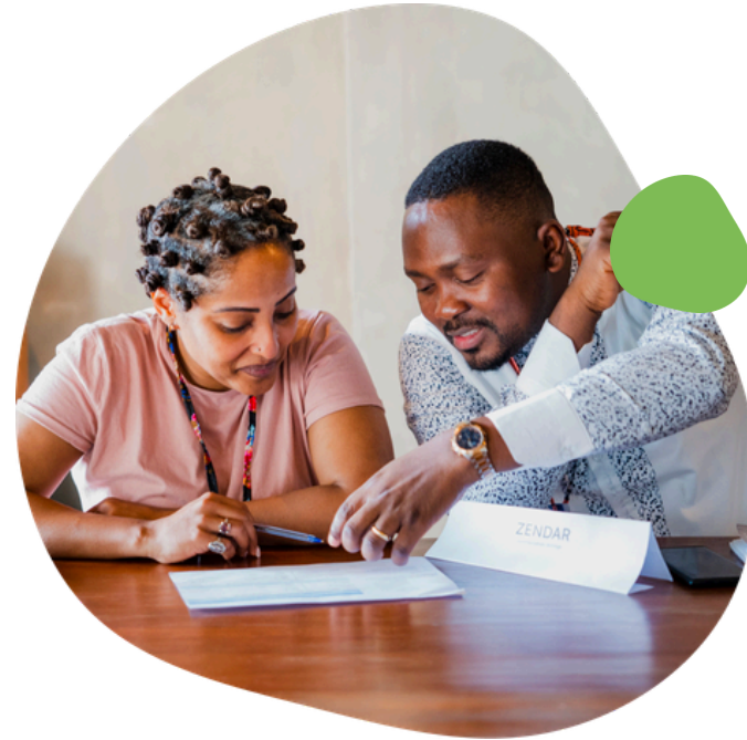
Co-creación de iniciativas