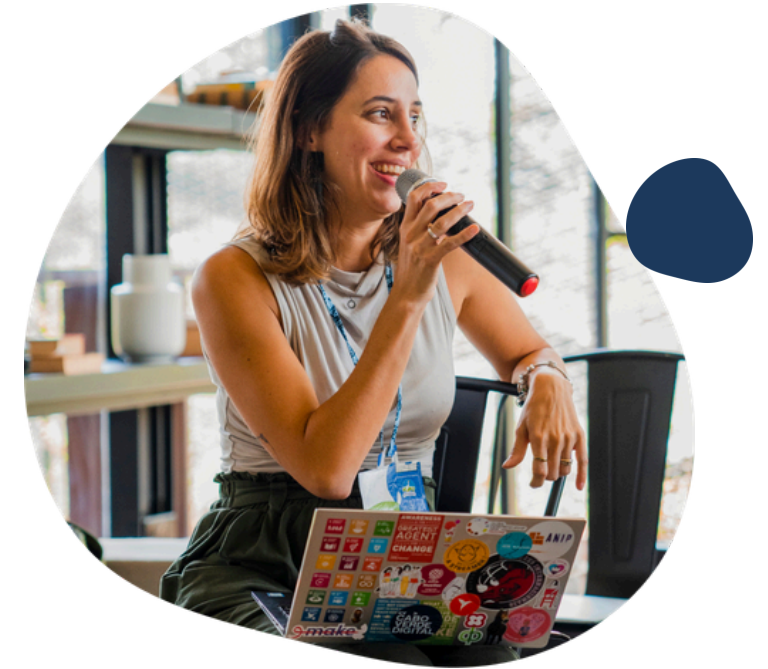
Alianzas de largo plazo

Durante 2026, Impact Hub San Salvador espera contribuir al fortalecimiento del ecosistema emprendedor a través de actividades focalizadas y programas estructurados.