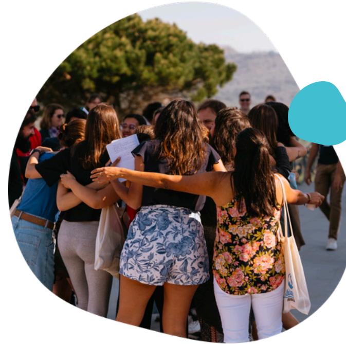
Consultoría a la medida