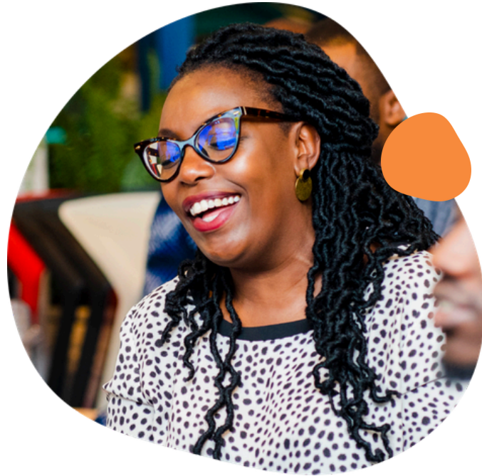
Patrocinio de eventos y programas