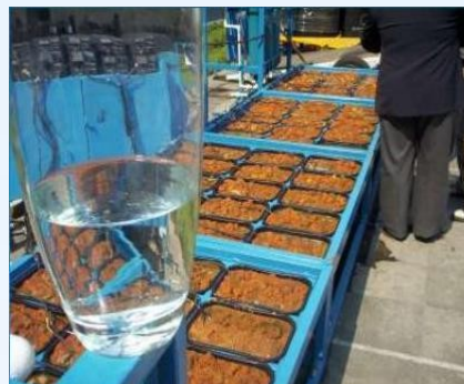
Demonstração de Repotabilização