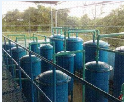
Chiapas Mx 1,100 m 3 /dia