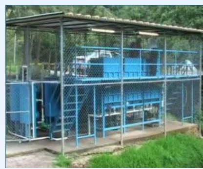
Mexico Mx 100 m 3 /dia