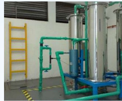
Escritórios Corporativos 75 m 3 /dia