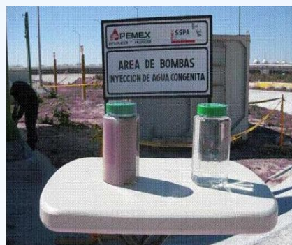
Amostras de Tratamento de Água Congênita O&G