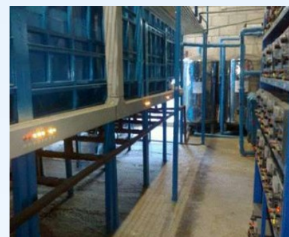
Cidade Mexico 100 m 3 /d