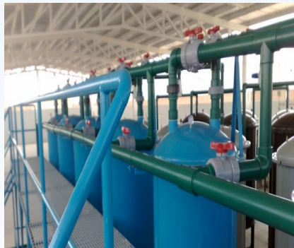
Indústria Têxtil 5,400 m 3 /dia