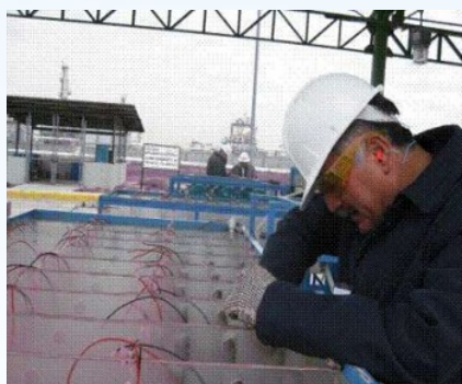
Refineria O&G, Mx