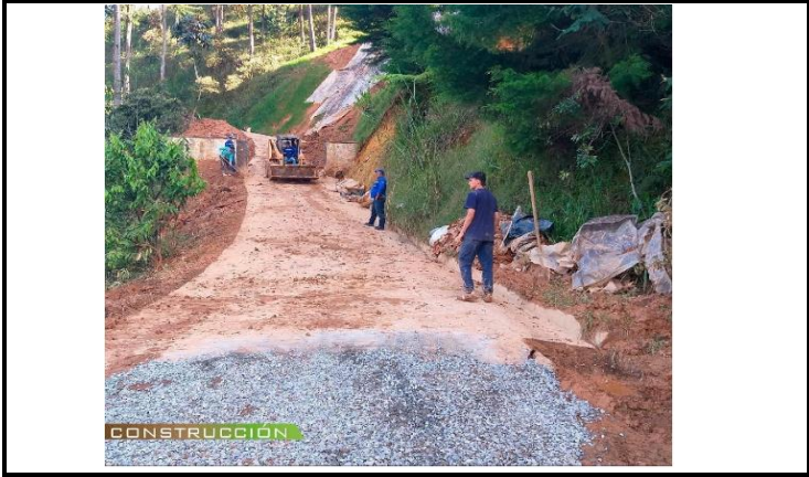
Mejoramiento vías terciarias, con construcción de placa huellas