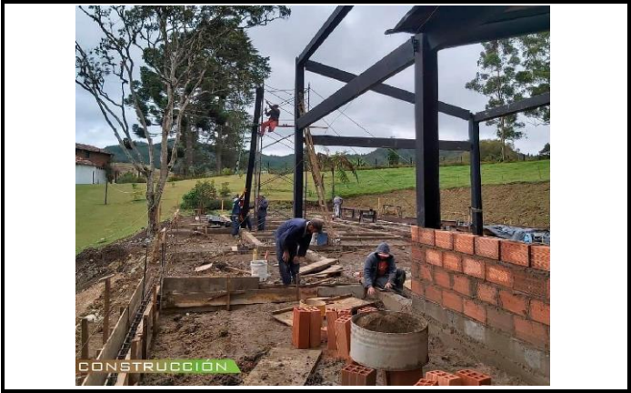
Construcción (Estructura Metálica, Muros mampostería y Vigas Cimentación)