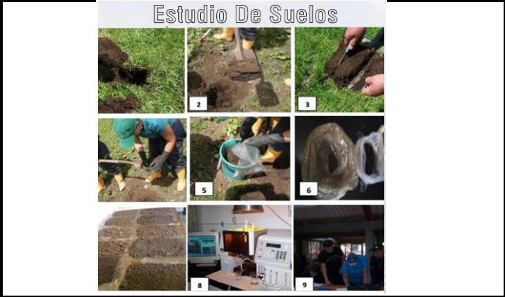
Estudio de suelos