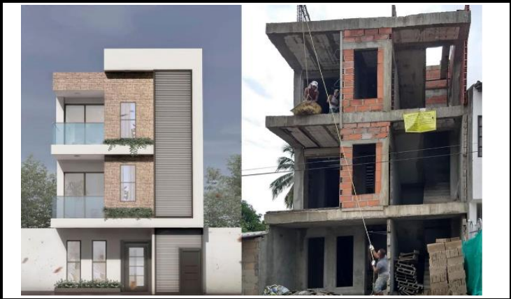
Modelado 3D y construcción de edificación para viviendas