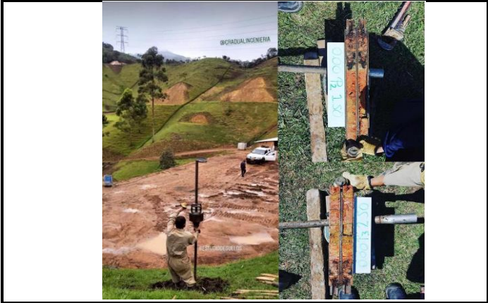
Estudio de suelos