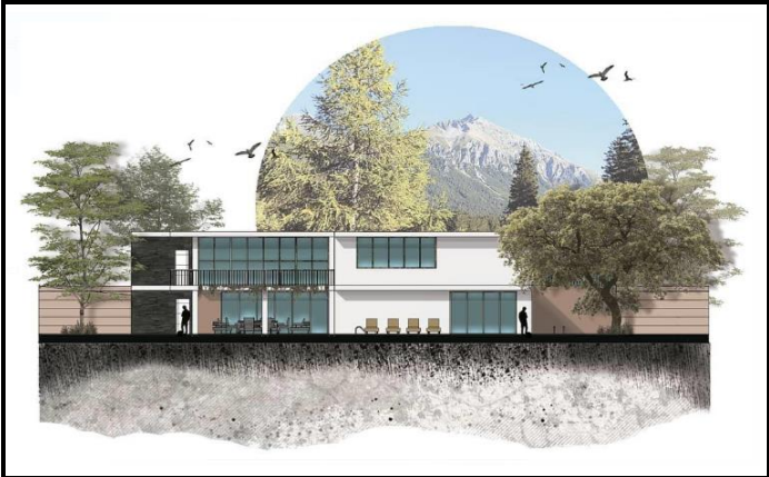
Diseño de Exteriores (Arquitectura)