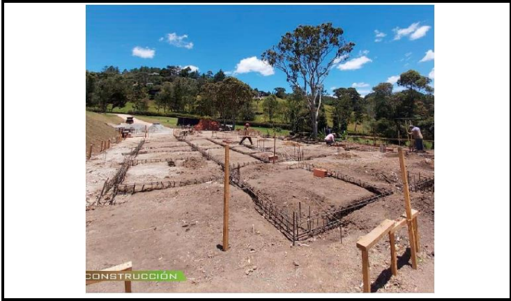
Construcción (Parrilla vigas de cimentación)