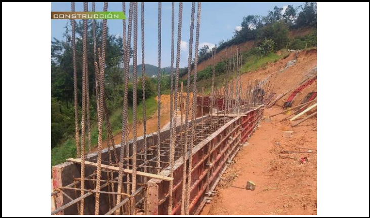
Construcción estructuras de contención