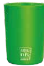
Vaso ecológico 320ml Green Cups®

Código: LD280GCVD Diámetro: 6,5 cm Altura: 11,7cm Peso: 40 g