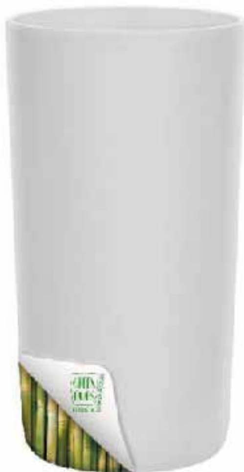
Green Cups 280 ml