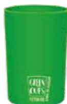
Vaso ecológico 200ml Liso Green Cups®

Código: SD200GCVD Diámetro: 6,5 cm Altura: 9 cm Peso: 35 g