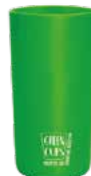
Vaso ecológico 280ml Green Cups®

Código: SD200GCLVD Diámetro: 6 cm Altura: 9 cm Peso: 30 g