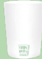
Vaso ecológico 320ml Green Cups® Branco

Código: LD280GCBR Diámetro: 6,5 cm Altura: 11,7 cm Peso: 40 g