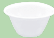
Cremera Ecológica 130 ml Green Cups® Branco

Código: RAM90GCBR Diámetro: 7 cm Altura: 4,2 cm Peso: 16 g