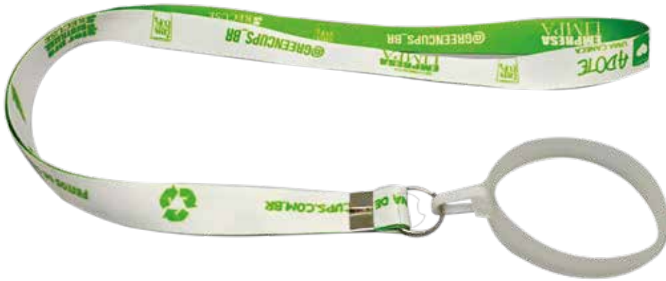
Cordón Green Cups® con Porta Vaso de Silicona

Código: CORDPORTGC Longitud: 120 cm Altura: 2 cm