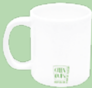
Taza ecológico 300ml Green Cups® Branco

Código: BD500GCBR Diámetro: 7,5 cm Altura: 14,5 cm Peso: 75 g