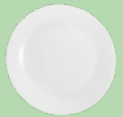
Plato Ecológico 18 cm Green Cups® Branco

Código: CRM130GCBR Diámetro: 10 cm Altura: 5,5 cm Peso: 31 g