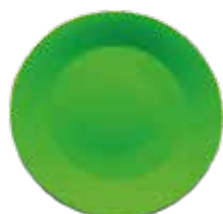
Plato ecológico 18 cm Green Cups® Verde

Código: CRM130GCVD Diámetro: 10 cm Altura: 5,5 cm Peso: 31 g