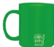
Vaso ecológico 300ml Green Cups®

Código: BD500GCVD Diámetro: 7,5 cm Altura: 14,5 cm Peso: 75 g