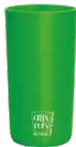
Vaso ecológico 500ml Green Cups®

Código: CD360GCLVD Diámetro: 8 cm Altura: 12 cm Peso: 50 g