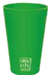
Vaso ecológico 360ml Green Cups®

Código: BD320GCVD Diámetro: 7,2 cm Altura: 10 cm Peso: 50 g