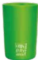
Vaso ecológico 200ml Texturizado Green Cups®

Código: TE70GCVD Diámetro: 5 cm Altura: 6,3 cm Peso: 20 g