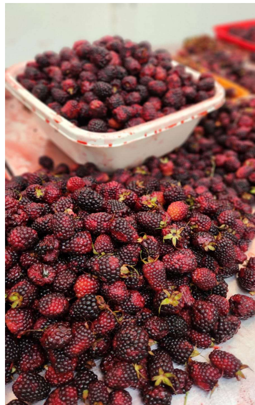
MIX EN FUNDA DE FRUTAS ENTERA