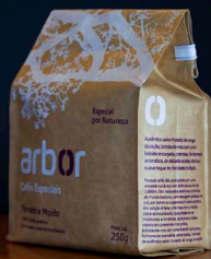
Café Torrado e Moído