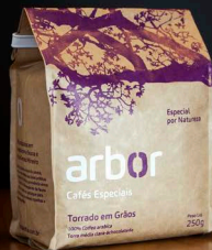
Café Torrado em Grãos