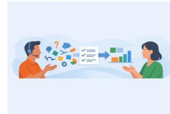
Comunicación eficaz -40 h-