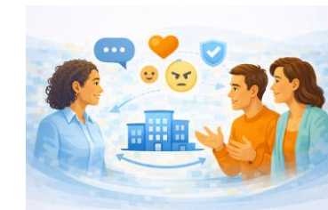
Escucha Activa, empatía y asertividad -8 h-