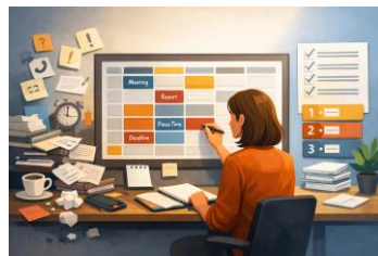
Gestión del tiempo -25 h-