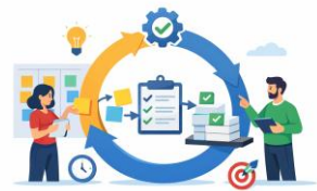
Metodologías Ágiles -30 h-

Dale a tu equipo las herramientas y metodologías para adaptarse a un entorno empresarial en constante evolución.