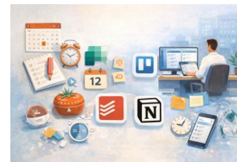
Herramientas para la productividad -25 h-