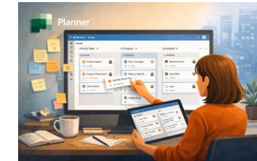
Microsoft Planner -10 h-