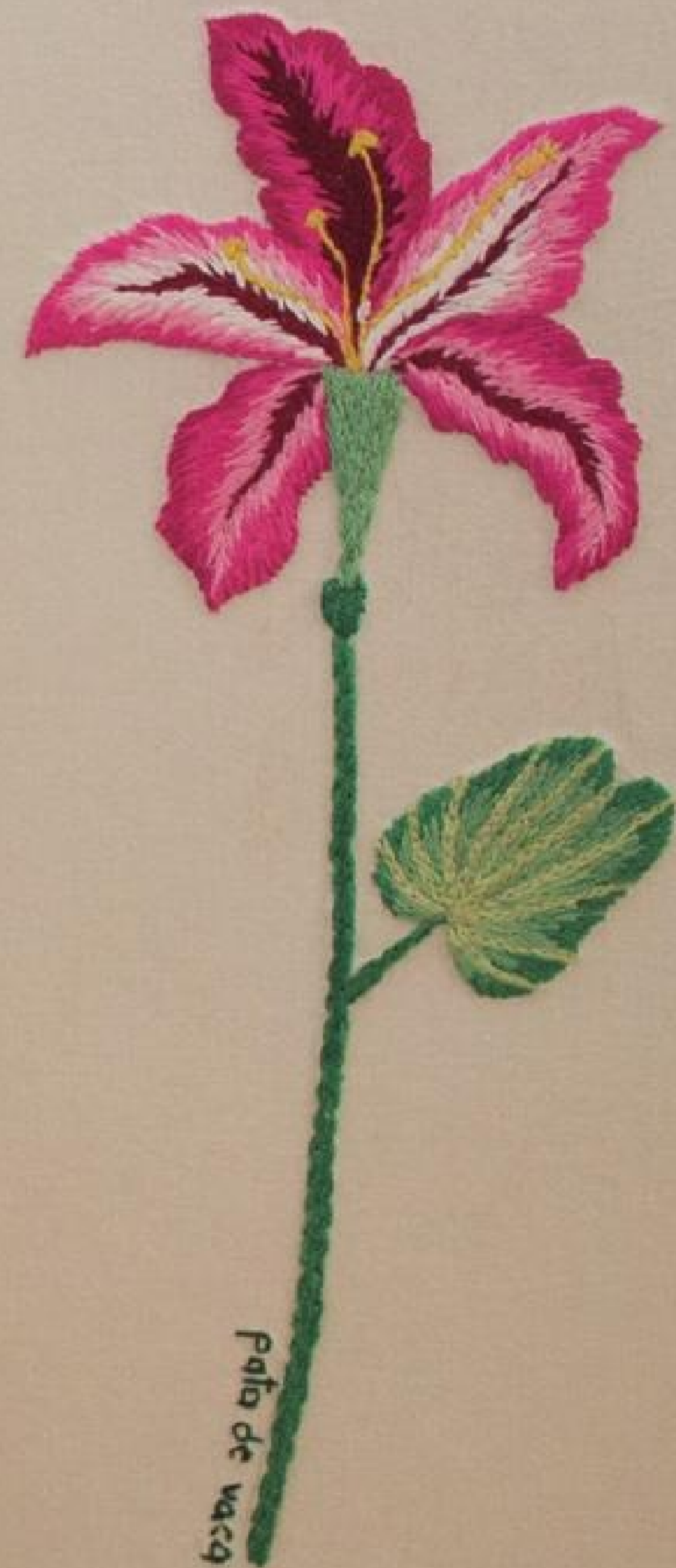
Pata de vaca