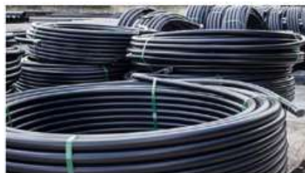
MANGUERA DE POLIETILENO