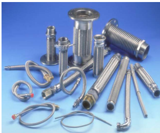
MANGUERAS FLEXIBLES METALICAS