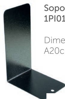
Soporta Libros 1PI010