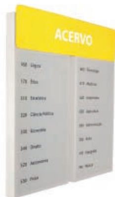
Panel Señalizador Fenix Doble 1FE040 + 1FE041.2

Compuesto por 2 paneles y 1 testera doble para estantes Fenix doble.