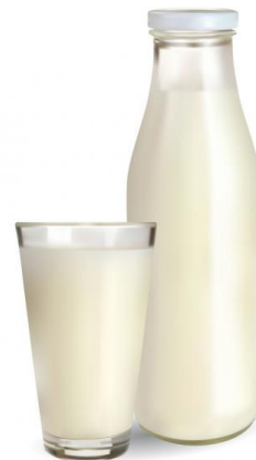
Leche (Whey Protein)