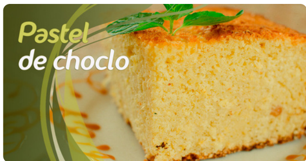
Pastel de choclo