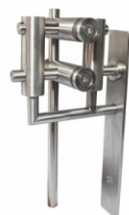
ESP Pivote Con Soporte a Vidrios fijos