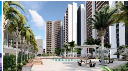
TRIII Proyecto ejecutivo de estructura Superficie: 40.000m 2 Santa Cruz de la Sierra · Bolivia