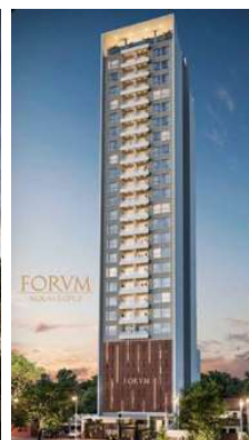
FORUM MOLAS LÓPEZ Proyecto ejecutivo de estructura (co-ejecución con ing. Federico Taboada) Superficie: 11.000m 2 Asunción · Paraguay