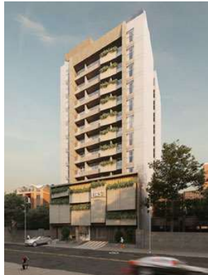
FIRST LIVING Proyecto ejecutivo de estructura Superficie: 6.500m 2 Asunción · Paraguay