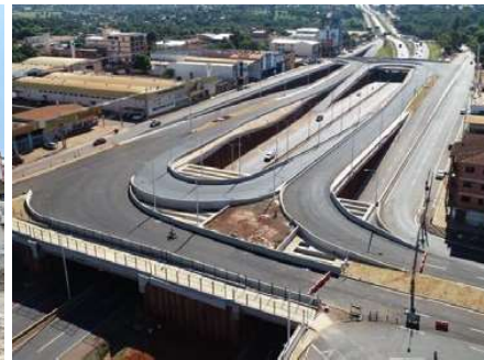
MULTIVIADUCTO Km 7 CDE Ciudad del Este · Paraguay