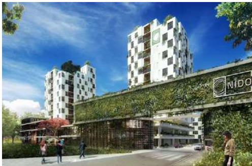
NIDO CONDOMINIO JARDÍN Proyecto ejecutivo de estructura Superficie: 52.000m 2 Santa Cruz de la Sierra - Bolivia