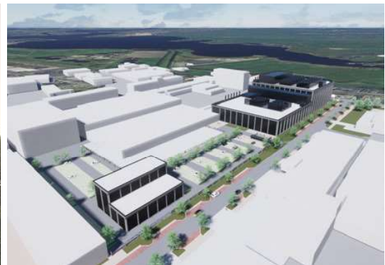
IRON MOUNTAIN Proyecto ejecutivo de estructura prefabricada de hormigón y acero Superficie: 13.700 m 2 Ámsterdam · Países Bajos