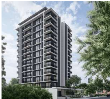
UD SANTA TERESA Proyecto ejecutivo de estructura Superficie: 7.100m 2 Asunción - Paraguay