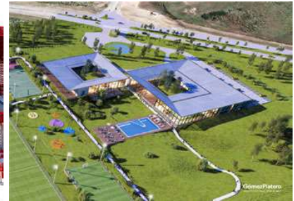
CLUB DEPORTIVO CASH Proyecto ejecutivo de estructura Superficie: 6.200m 2 Montevideo · Uruguay