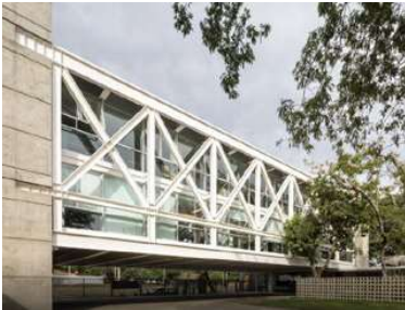
OFICINAS DC Proyecto ejecutivo de estructura Superficie: 12.500m 2 Asunción · Paraguay