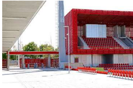
ACADEMIA ATLÉTICO DE MADRID Co-ejecución con CD Consultoría Superficie: 8.000m 2 Madrid · España