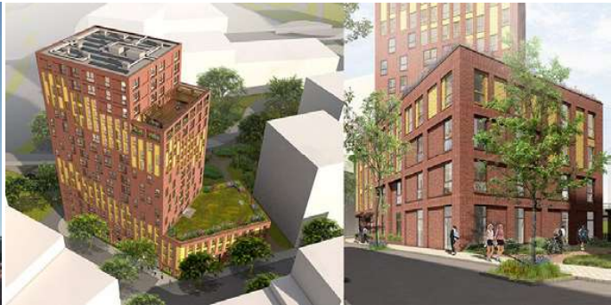
TALIS Proyecto ejecutivo de estructura industrializada Superficie: 11.300m 2 Nijmegen · Países Bajos