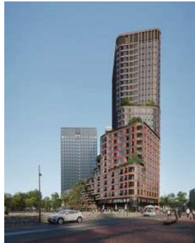
BRINKTOREN Proyecto ejecutivo de estructura industrializada Superficie: 29.700m 2 Ámsterdam · Países Bajos