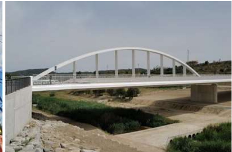
VIADUCTO IGUALADA Cataluña · España