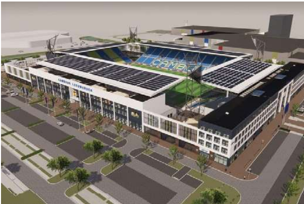
CAMBUUR Proyecto ejecutivo de estructura prefabricada de hormigón y acero Superficie: 23.000 m 2 Leeuwarden · Países Bajos