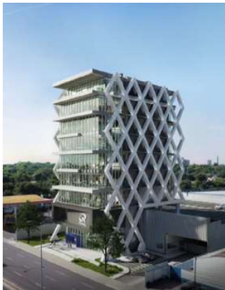
OFICINAS QUIMFA Proyecto ejecutivo de estructura Superficie: 6.000m 2 Asunción - Paraguay