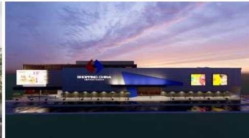
SHOPPING CHINA CDE Proyecto ejecutivo de estructura Superficie: 89.000m 2 Ciudad del Este · Paraguay