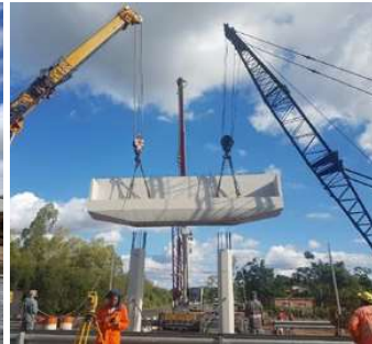
VIADUCTO ÑU GUASU Asunción · Paraguay