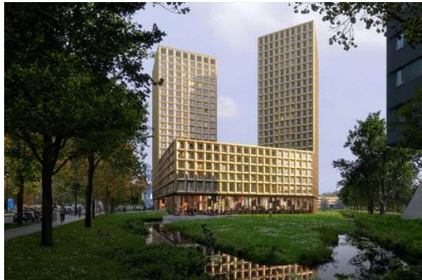
HIGH FIVE Proyecto ejecutivo de estructura industrializada Superficie: 30.500m 2 Utrecht · Países Bajos