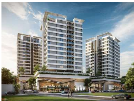
COMPLEJO BOULEVARD PLAZA Proyecto ejecutivo de estructura Superficie: 32.500m 2 Asunción · Paraguay