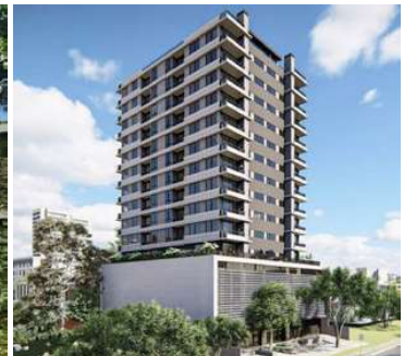
INARCO BOGGIANI Proyecto ejecutivo de estructura Superficie: 10.900m 2 Asunción - Paraguay