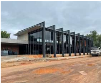
OFICINAS LACERIE Proyecto ejecutivo de estructura Superficie: 1.900m 2 Asunción · Paraguay