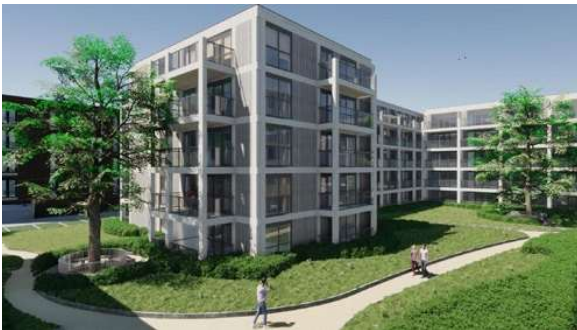
FULTONBAAN Proyecto ejecutivo de 4 bloques de estructura prefabricada de hormigón Superficie: 15.100m 2 Nieuwegein · Países Bajos