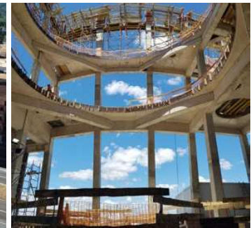
SPRAY 3 Complejo industrial Villa Rodríguez San José · Uruguay