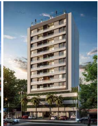
EDIFICIO INFINITY Proyecto ejecutivo de estructura (co-ejecución con Ing. Jesús Jiménez) Superficie: 5.800m 2 Asunción - Paraguay