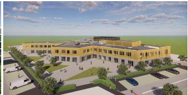
AXIA COLLEGE Proyecto ejecutivo de estructura prefabricada de hormigón y acero Superficie: 56.000 m 2 Amersfoort · Países Bajos