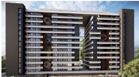
AZ ESPAÑA LAS MERCEDES Proyecto ejecutivo de estructura Superficie: 20.400m 2 Asunción · Paraguay