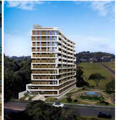
PASEO DE LOS TEROS Proyecto ejecutivo de estructura Superficie: 7.500m 2 Encarnación · Paraguay