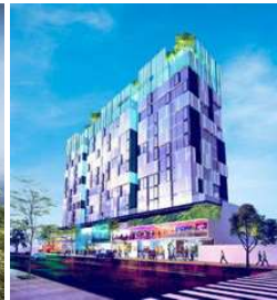
NANOTEC Proyecto básico de estructura Superficie: 17.000m 2 Santa Cruz de la Sierra · Bolivia