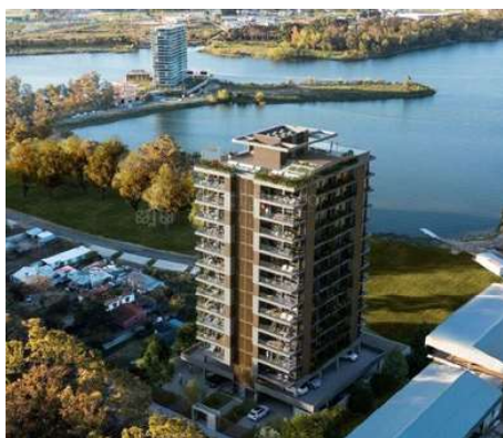
BORNEO LAGO Proyecto ejecutivo de estructura Superficie: 6.300m 2 Ciudad de la Costa · Uruguay