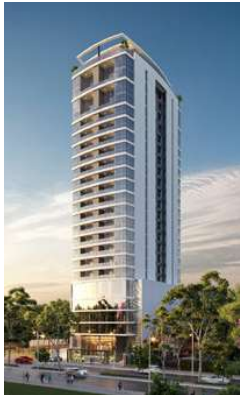
THE ADDRESS Proyecto ejecutivo de estructura Superficie: 18.500m 2 Asunción · Paraguay