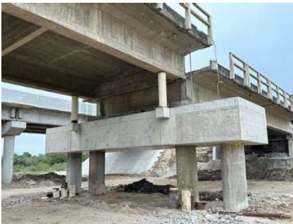
PUENTE A° MALDONADO Ruta 9 Montevideo · Uruguay