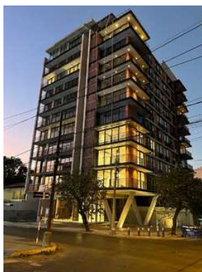
PLAZA PACHECO Proyecto ejecutivo de estructura Superficie: 5.900m 2 Asunción · Paraguay