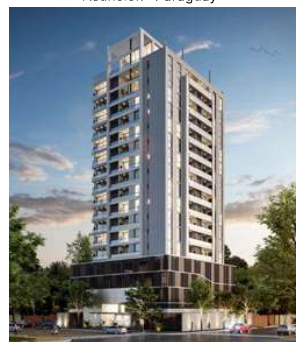
EDIFICIO MARQUIS Proyecto ejecutivo de estructura (co-ejecución con ing. Jesús Jiménez) Superficie: 11.300m 2 Asunción · Paraguay