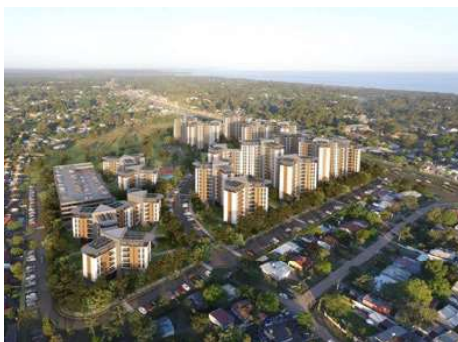
COMPLEJO HABITACIONAL GIANNATTASIO Anteproyecto de estructura para prefabricación modular Superficie: 95.000m 2 Canelones · Uruguay