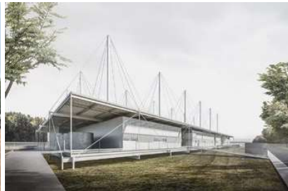
LABORATORIO CARU Concurso - Anteproyecto Superficie: 1.850m 2 Montevideo · Uruguay