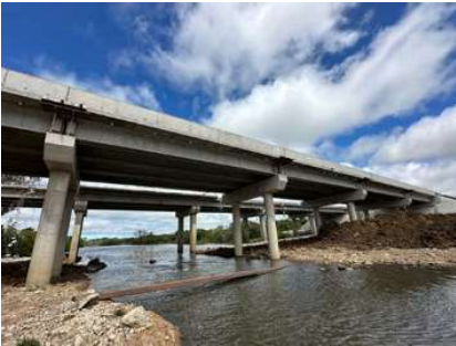
PUENTE A° JOSÉ IGNACIO Ruta 9 Montevideo · Uruguay