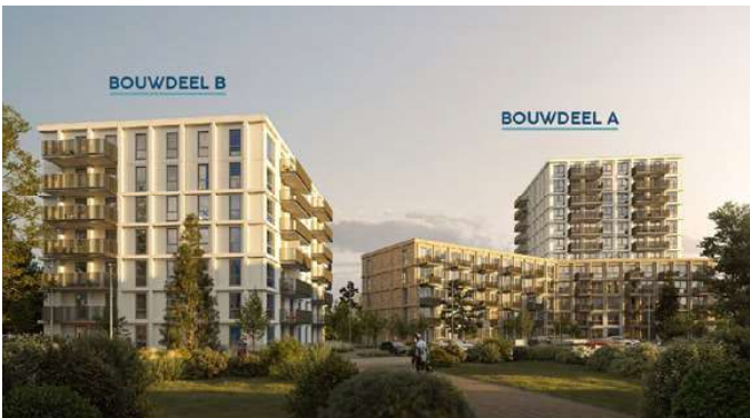
UPPLIVING Edificio residencial con dos bloques de 7 y 12 pisos Cálculo de elementos sándwich de fachada y balcones prefabricados Alphen aan de Rijn · Países Bajos