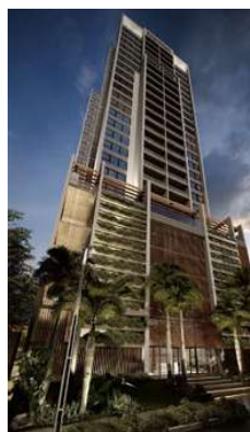
ALBOR Proyecto ejecutivo de estructura Superficie: 16.500m 2 Asunción · Paraguay