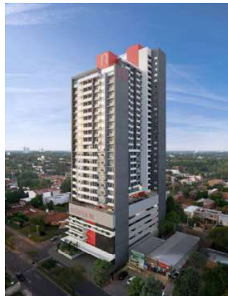
ECIPSA MOLAS LÓPEZ Proyecto ejecutivo de estructura Superficie: 33.500m 2 Asunción - Paraguay