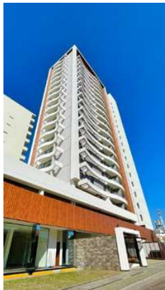
MACORORÓ 12 Proyecto ejecutivo de estructura Superficie: 12.000m 2 Santa Cruz - Bolivia