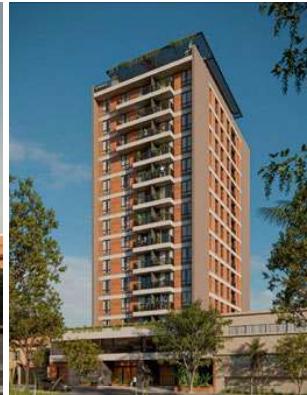
LIVIT SANTA TERESA Proyecto ejecutivo de estructura Superficie: 7.600m 2 Asunción · Paraguay