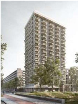
AUGUST ALLEBEPLEIN Proyecto ejecutivo de estructura industrializada Superficie: 11.200m 2 Ámsterdam · Países Bajos