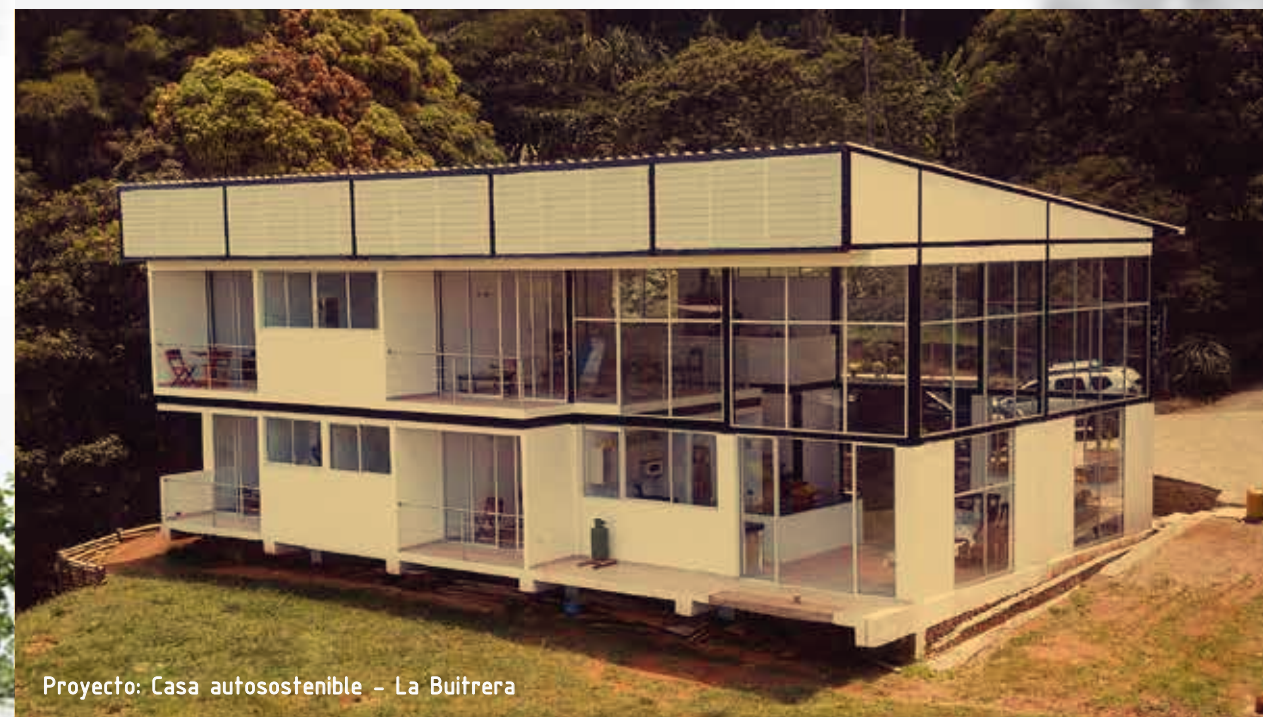
Proyecto: Casa autosostenible – La Buitrera

GENSAR En la creación de su razón social, desarrolla todos sus proyectos comprometida con la Calidad, la Seguridad Industrial y con el Medio Ambiente, bajo el estricto cumplimiento del marco legal, garantizado de manera integral.