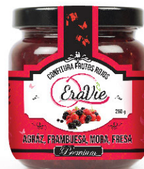
AGRÁZ, FRAMBUESA, MORA, FRESA. CONFITURA