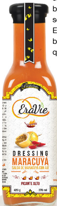
MARACUYÁ DRESSING SALSA PICANTE

SIN GLUTEN SIN CONSERVANTES NATURAL MENOS AZÚCAR SIN COLORANTES