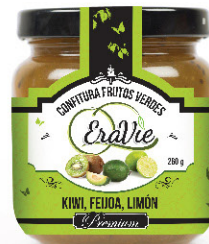
KIWI, FEIJOA, LIMÓN. CONFITURA