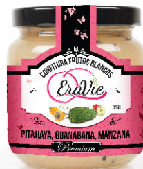
PITAHAYA, GUANÁBANA, MANZANA. CONFITURA

SIN GLUTEN SIN CONSERVANTES NATURAL MENOS AZÚCAR SIN COLORANTES