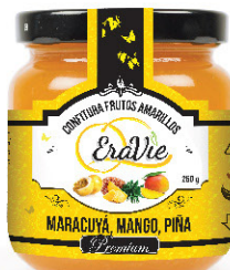
MARACUYÁ, MANGO, PIÑA. CONFITURA