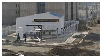
Casetas de equipos de la EBAR. Ciudad del Valle – Candelaria