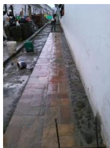
Reposición de espacio público