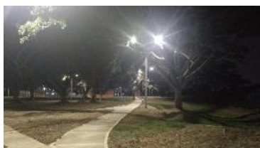
Adecuaciones de parques. Ciudad del Valle – Candelaria