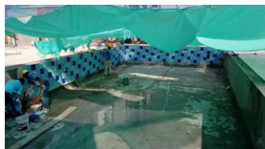
Construcción de piscinas