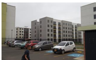
Construcción de parqueaderos