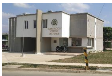
CAI Poblado Campestre