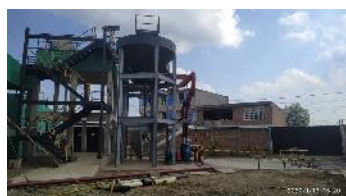
Obra Civil PTAR - Ampliación de la Planta de Tratamiento de aguas residuales – Aquaservicios – Poblado Campestre Candelaria