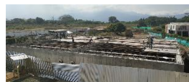
Construcción de tanques de almacenamiento de agua.