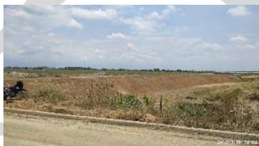
Construcción de Jarillones