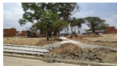
Parques Ciudad del Valle