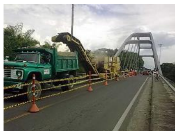
Reposición de pavimentos en vías nacionales