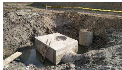
Redes del alcantarillado Pluvial y Sanitario