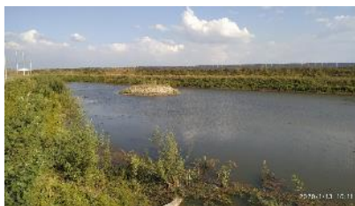
Lagunas de regulación aguas lluvias