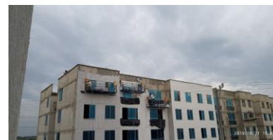
Pintura y terminado de Fachadas de edificaciones