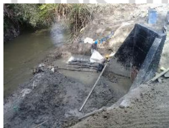
Construcción de Cabezales y obras de arte.