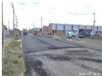
Pavimentación de vías Principales y Urbanas