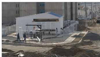
Construcción EBAR Estación de bombeo de aguas residuales