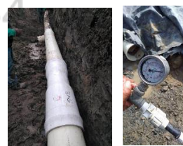
Instalación de redes de acueducto Ciudad del Valle – Candelaria