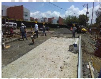
Construcción de pavimento rígido – MR 42