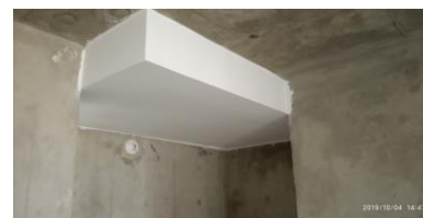
Detallado de estructuras y Acabados