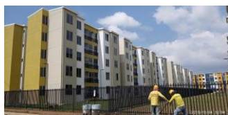
Cerramientos y espacio Público