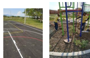
Construcción de canchas y adecuación para juegos infantiles