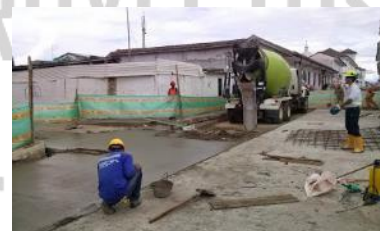
Reposición de pavimentos en zonas urbanas