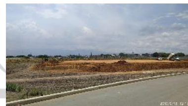
Rellenos de gran magnitud