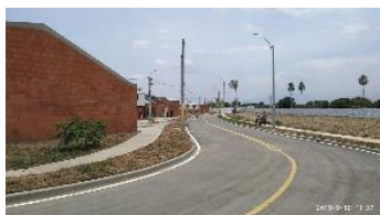
Adecuaciones de zonas verdes y andenes. Ciudad del Valle – Candelaria