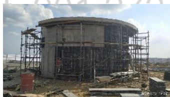
Construcción de tanques Ptar. Ciudad del Valle – Candelaria