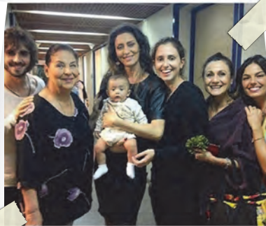
EQUIPE DE "A FORÇA DO QUERER"