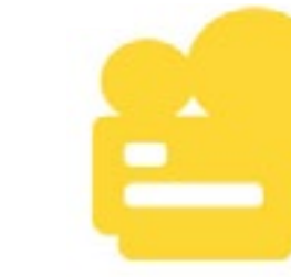
Diseño de materiales escritos y audiovisuales