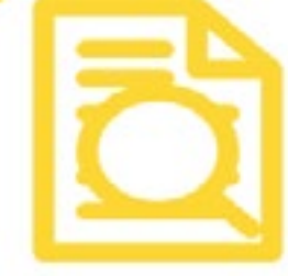
Diseño, ejecución y evaluación de investigaciones sociales y sistematización de experiencias

La construcción constante de un mundo común