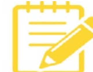
Diseño, ejecución y evaluación de proyectos sociales