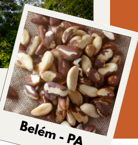
Belém - PA